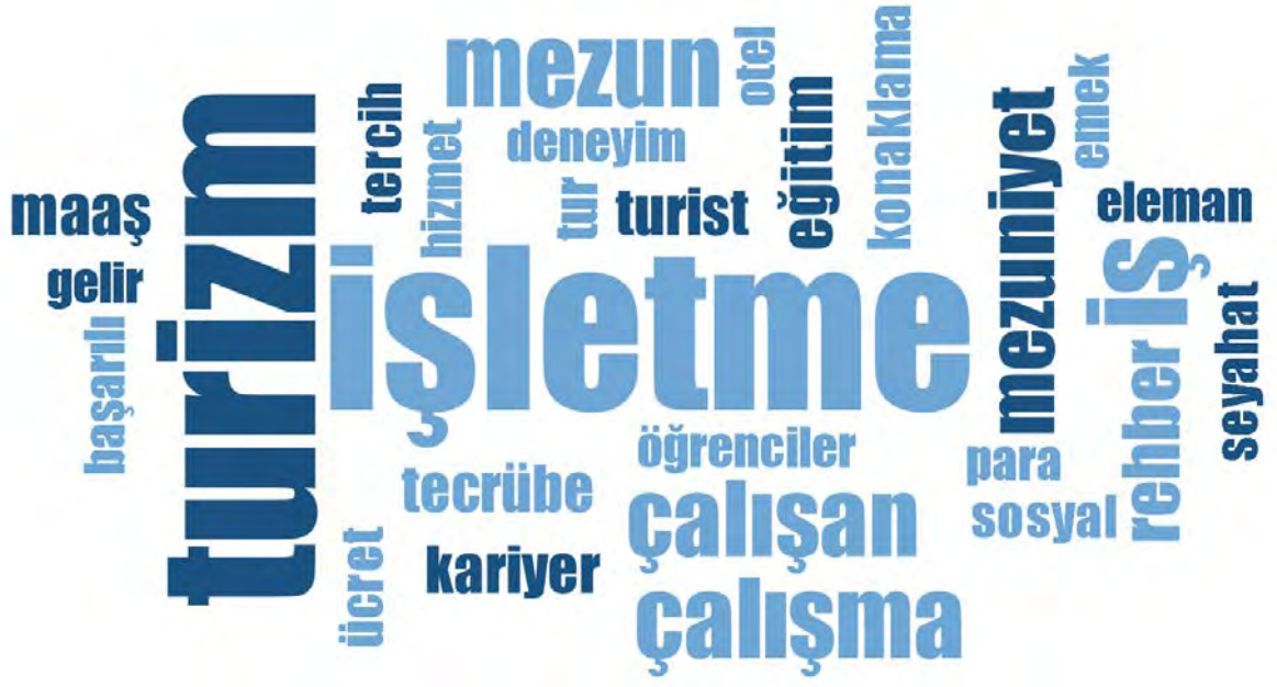
Şekil 1. Kelime Bulutu Sonuçları