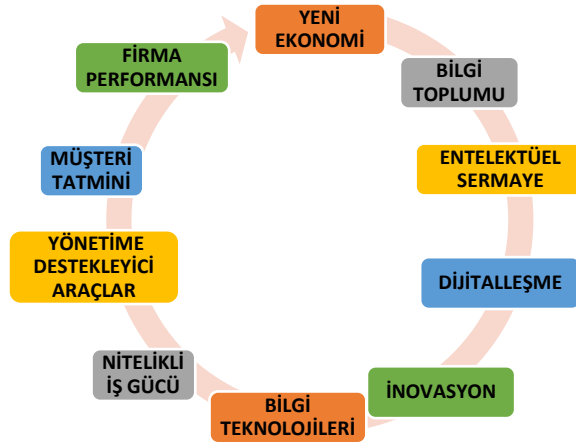
Şekil 1. Entelektüel Sermaye ile Firma Performansı Döngüsü