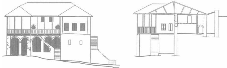
Şekil.7 Berat’ta çardaklı bir ev [5]

Nur Akın’ın Balkanlarda Osmanlı Dönemi Konutları isimli kitabında incelenen örneklerde de çatı eğiminin orta-dik eğimde olmasına karşılık, yine de çatı aralarının kullanıma genelde katılmadığı Şekil.7’de görülür. Yine aynı kitapta yer alan Osmanlılar döneminde Balkan kent yerleşmeleri örneklerinden biri olan Arnavutluk’ta önemli bir yerleşme olan Berat kenti genel görünümü Şekil.8’de verilmektedir [5].