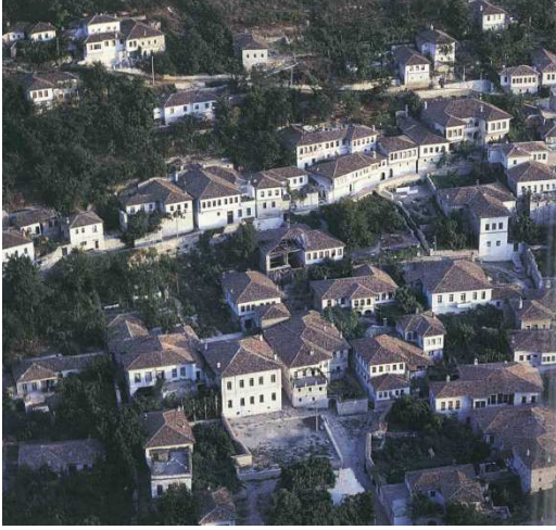
Şekil.8 Arnavutluk-Berat genel görünüm [5]