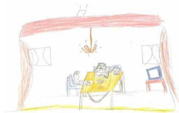
Şekil.4 'Ev'in içi [2]