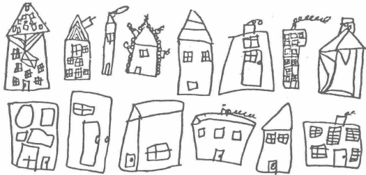
Resim 34. E ve K/5:0

'Çatı' kavramı, çocukluktan başlayarak içinde doğduğumuz, büyüdüğümüz evin bir parçası olmasının yanı sıra, 'başını sokma', 'sığınma', 'barınma', 'korunma', 'güven' gibi insana güven veren çeşitli anlamları da yüklenir. Şekil.3'te görüldüğü üzere, 4-7 yaş arası çocukların çizdikleri tipik ev resimlerinin çoğunda evlerin eğik çatı ile bitirildiği görülmektedir [2]. Evin içine ilişkin resimlerde ise genellikle, Şekil.4'te görüldüğü gibi tavan düzdür [2]. Bu iki sınır arasında kalan hacmin çocukların zihninde yer almadığı görülmektedir. Bu resimler aslında hepimizin yaşamımızda karşılaştığı durumu yansıtmaktadır.