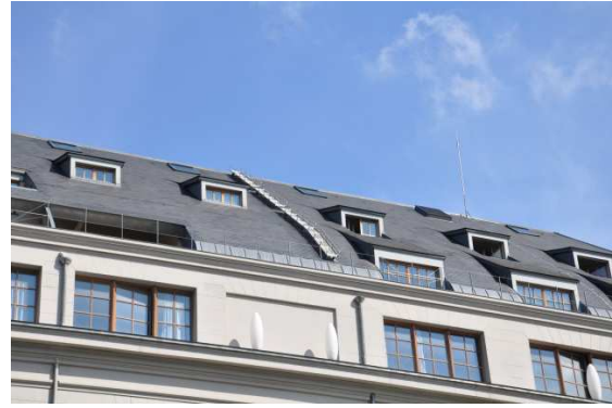
Şekil.1 Londra'da Mansard çatı kullanımı