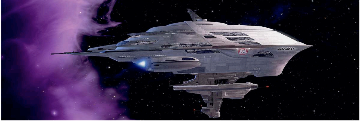
ŞEKİL 3) http://pixar.wikia.com/WALL%E2%80%A2?file=WALLEship.jpg

“uzaya geleli 700 yıl oldu ama hala eski yaşamımıza benzer yaşam tarzımızı sürdürüyoruz” diyerek kapitalist anlayışın Axiom’da ve uzayda hala devam ettirildiğini vurgulamaktadır. İşte tam da burada bilim kurgu mitlerden, masallardan, ütopyalardan, distopyalardan toplumsal işlevi ve yaklaşımı bakımından farklılaşır. Ünsal Oskay tüm bu türler içinde bilim kurgunun farklı olarak yaşanan zamanın ve toplumun doğallaştırdığı algılama biçimlerinden kendini yabancılaştırmaya çalışan bir tür olduğunu vurgular. Ona göre bilimkurgu dünyanın bizim bildiğimiz dünyadan farklı olabileceği düşüncesinden ve ampirik olarak bile yeniye olan ilgiden ortaya çıkmaktadır(2014:33). Axiom gemisinin insanları yani günümüzün dünyalılarını, bir başka dünyanın ve farklı bir yaşamın olabileceğini vurgulamaya çalışan tüm paradigmaları dikkatle izlemelidir. Axiom’da yaşananlar bugün yaşadığımız dünyanın algılama biçimlerine yöneltilmiş bir aynadan yansımalar olarak ele alınmalıdır.