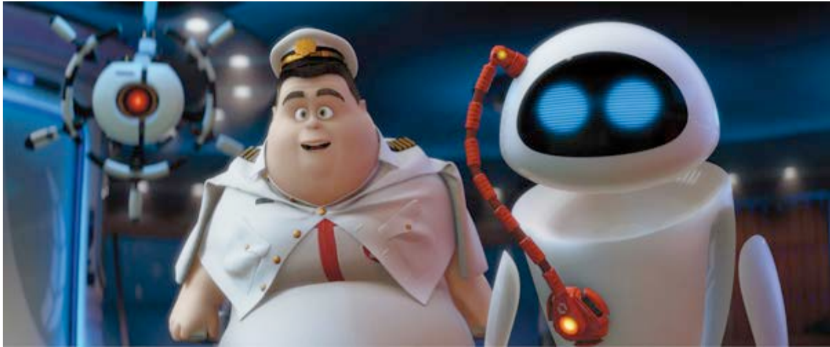
ŞEKİL 4) http://pixar.wikia.com/WALL%E2%80%A2?file=Autocaptaineve.jpg

Wall-E'de yer alan insan-makine ilişkisinin bir benzeri ilk kez Stanley Kubrick'in "2001: A Space Odyssey" adlı bilimkurgu filminde 1968 yılında kullanılmıştır. Ünlü bilimkurgu yazarı Arthur C. Clarke'ın romanından uyarlanan filmde mürettebatın bir üyesi de "HAL 9000" süper bilgisayarıdır. Yapay zekaya sahip Hall insan gibi iletişim kurmak ve etkileşime geçmek ve hatta insan duygularını taklit etmek için tasarlanmıştır. Gerçekte de astronotlar ona "Hal" diye hitap ederek mürettebattan biri gibi davranırlar. Bir keşif gezisinde Hal her işi halletmektedir. Bowman ve Poole robotsu davranırken Hal adeta insanlaşmış gibidir. Yani makine efendisi olan insana itaat etmemeye başlamıştır. Hatta tam tersi efendi rolüne talip olmuştur. Garip ve insansı hatalı davranışlar ortaya koymaya başlayan Hal'ün görevine son vermeye çalışılır. Ama Hall direnir. Tuzaklar kurar. Sonunda devre dışı bırakılır.