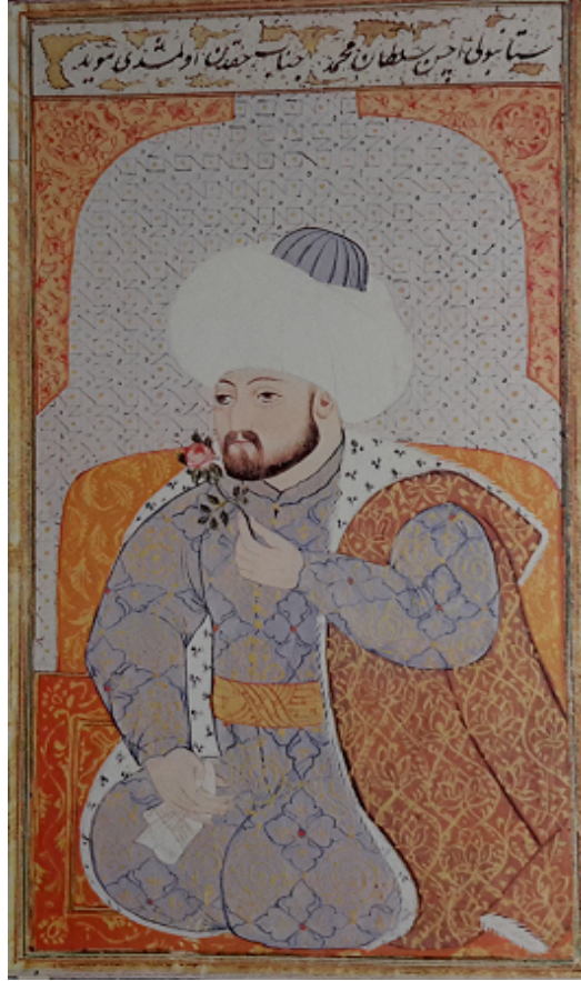
Şekil 1. Sultan Mehmed Han'ın (Fatih) Portresi