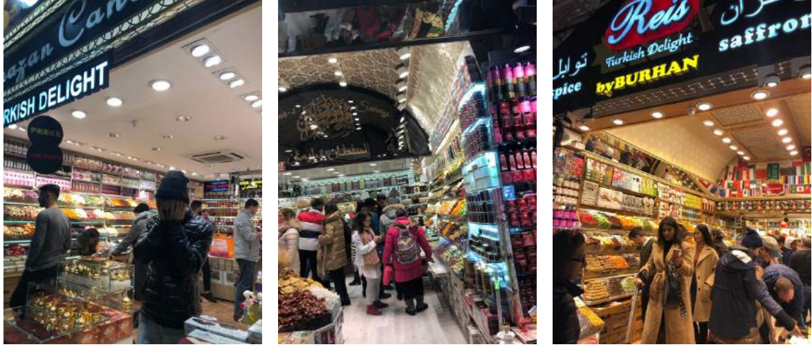
Resim 6-7-8: Kapalı Çarşı da dükkanların tavan örnekleri