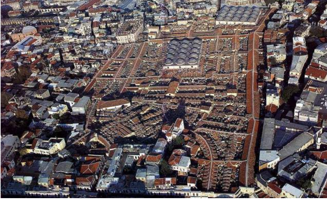
Resim 9: Kapalıçarşı Hava Fotoğrafi

Dönemin en ünlü taş ustası Nazar Usta ve yetiştirdiği çıraklar tarafından taş işçilikleri yapıldığı bilinen Çarşıda Marmara Bölgesinden çıkartılan beyaz, El – Aziz’ den getirilen vişne rengi ve Germiyan ilinden getirilen yeşil mermerler kullanılmıştır. Öyleki çarşının her yerinde kullanılan bu taşların bereket iksiri ile yıkandığı tarih boyunca dilden dile gezen bir söylenti olmuştur. Bu söylentiler yine Fuat Sevimay’ ın Kapalı Çarşı romanında ”Kapalı Çarşı’ nı bedestenleri ayağa kalkmış, yolları bereket iksirlerine bulanmış mermerlerle kaplanmış, çeşmesinden gürül gürül sular akmaya başlamış, dükkanları esnafı ağırlamak üzere hazır hale gelmişti. Yine cihanın en görkemli ...” şeklinde kaleme alınmıştır.