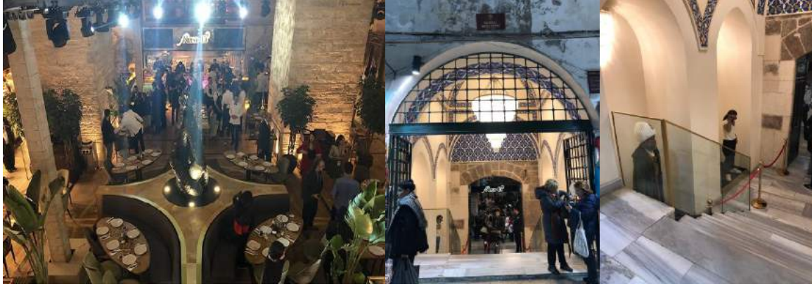
Resim 12-13-14 : Sandal Bedesteni günümüzdeki kullanım şekli Bir diğer yapının önemli unsuru Cevahir Bedesteni ise günümüzde çarşının her köşe ve duvarını saran dükkanlar nedeni ile net olarak algılanamamaktadır 3 .